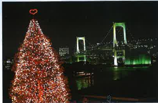
Christmas Light-up Illumination, Rainbow Bridge, Odaiba

ช่วงเวลา : ส่องอาทิตย์แรกของเดือนธันวาคม ที่ตั้ง : บริเวณ Old Foreign Settlement and Higashi-Yuenchi Park (Chuo Ward) การเดินทาง : จากสถานี Shin-kobe ขึ้นรถไฟใต้ดินลงที่สถานี Sannomiya เว็บไซต์ : www.kobe-luminarie.jp/ ภาษาญี่ปุ่น : www.kobe-luminarie.jp/ ภาษาอังกฤษ : http://www.hyogo-tourism.jp/english/area/kobe.html