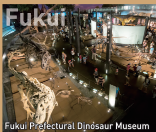
Fukui Prefectural Dinosaur Museum